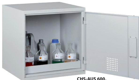
CHS-AUS 600, Artikel-Nr. B80-6223-A