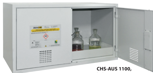
CHS-AUS 1100, Artikel-Nr. B80-6220-A