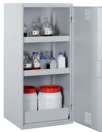
CHS 600-1300, Artikel-Nr. B80-6133-A