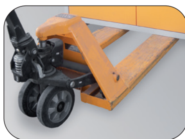
Inkl. Sockel, mit abnehmbarer Blende