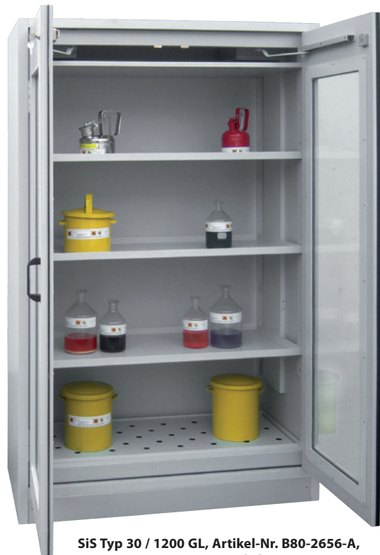
Sis Typ 30 / 1200 GL, Artikel-Nr. B80-2656-A, Türen RAL 7035 - lichtgrau, inkl. 3 Einlegeböden, Bodenwanne und Lochblechabdeckung