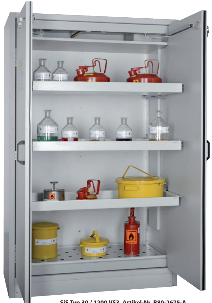
SiS Typ 30 / 1200 VS3, Artikel-Nr. B80-2675-A, Türen RAL 7035 - lichtgrau, inkl. 3 Auszugswannen